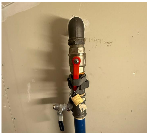
Figur 1 Stengeventil sprinkler, sone garasje, teknisk rom over vindfang

Alle tilpasninger skal utføres i henhold til NS-EN 12845 samt FG veileder FG-930:1. Etter ferdigstillelse skal anlegget funksjonstestes, trykktestes og dokumenteres før overlevering. Eventuelle midlertidige løsninger under byggeperioden skal godkjennes av brannrådgiver.